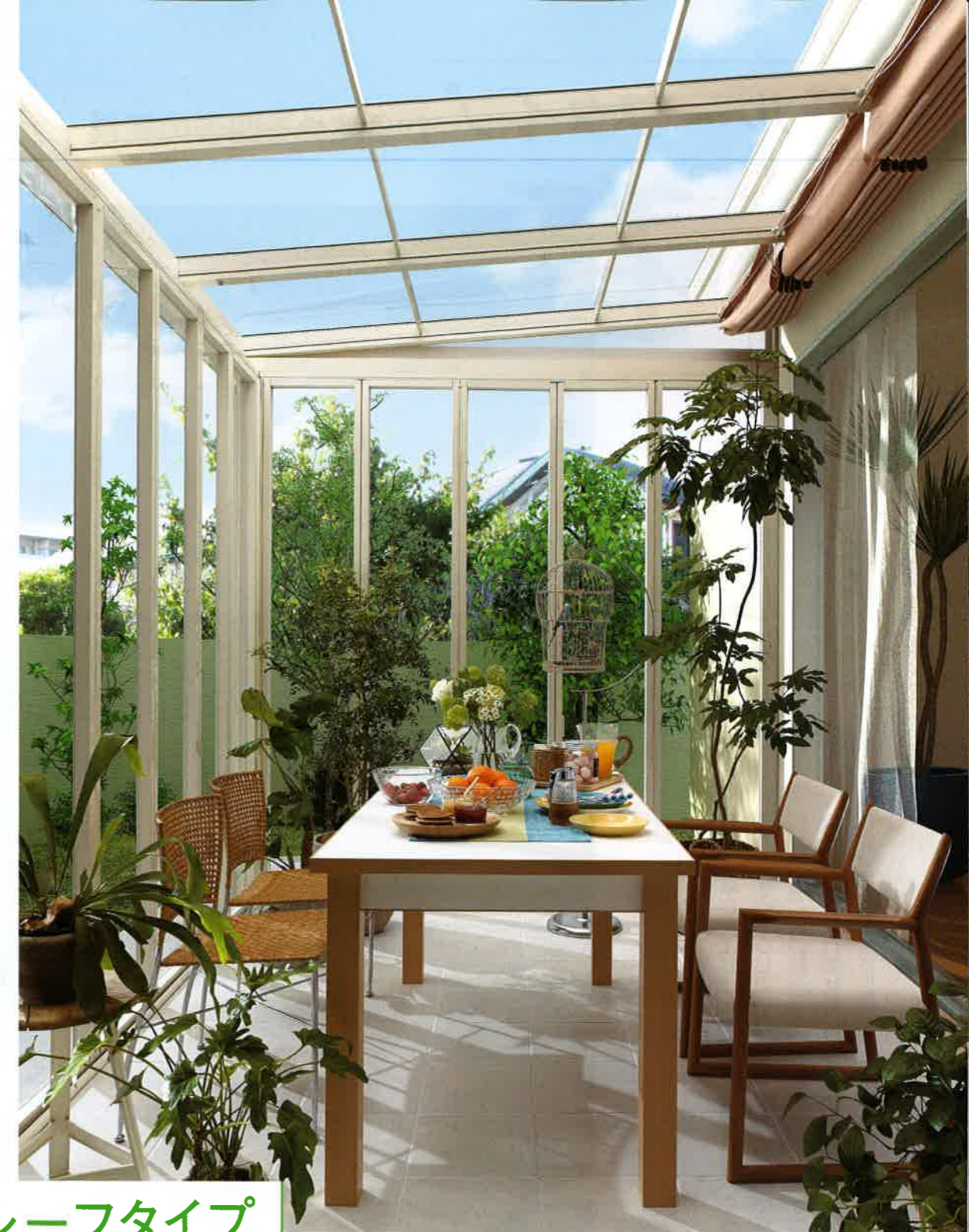
屋根部分に取り付けられるオプション

透明な屋根とパネルに囲まれた、光あふれるガーデンリビング空間。パネルを閉めていても陽射しが取込め、またパネルが風雨を防いでくれるので、自然に包まれながらも安心して過ごせます。大きな庭がなくてもガーデニングを楽しみたい人にもオススメです。