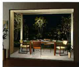
内天井に取り付けられるオプション

透明なパネルから見える景色の開放感と、内天井に覆われた空間の安心感は、部屋の中でくつろぐのとは違う、未体験のリラクゼーションを感じさせる軒空間。内天井にはライトが付けられるので、夜風に吹かれてのディナーというシチュエーションも自宅で楽しめます。